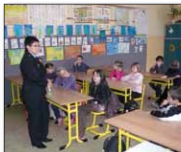
Prevence šikany, str. 15