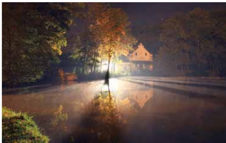
F5 – Večer u mlýna