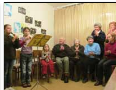
Výstava v Husově kapli, str. 17