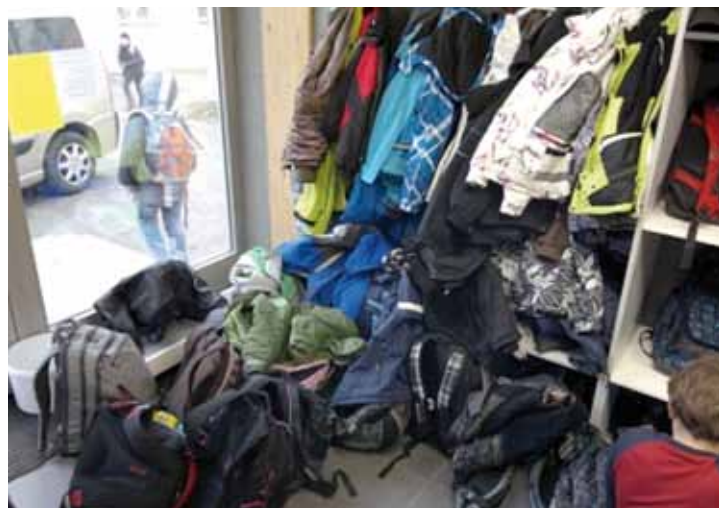
Tohle už je minulost

že než by se tak reálně stalo, tak by došlo k poškození dřevěných stupňů u jídelny, zároveň by děti roznášely při mokru špinu všude okolo (a také by ji měly na sobě). Proto, jakmile to klimatické podmínky dovolí, bude prostor mezi