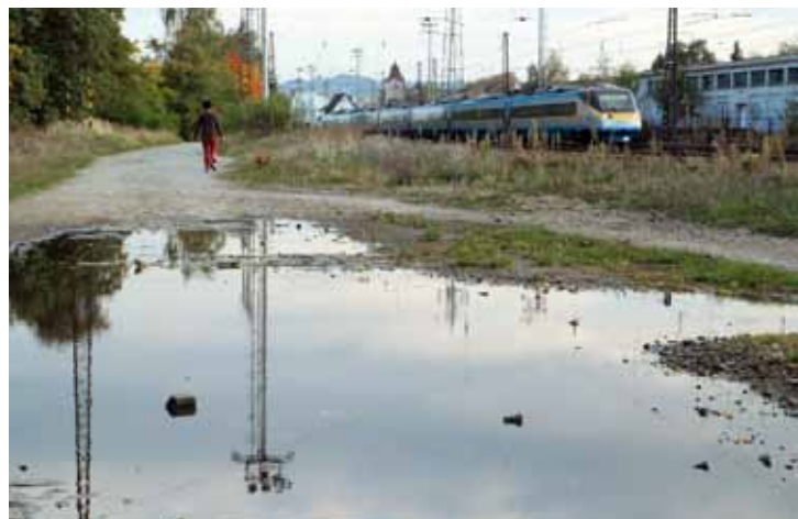
F 4 – Cesta k nádraží