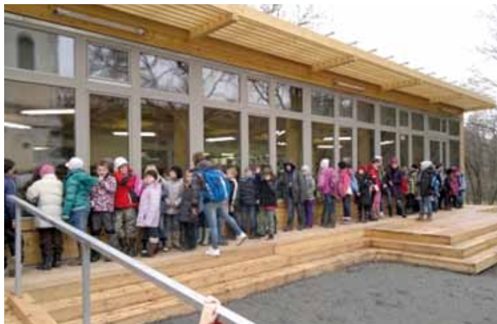
Fronta na oběd

Mnoho rodičů se rovněž dotazovalo, jestli je současný povrch před školní jídelnou definitivní. Původní představa architektů byla, že ano a že stávající šotolinový povrch se časem utáhne a přirozeně ztuhne. Ukázalo se,