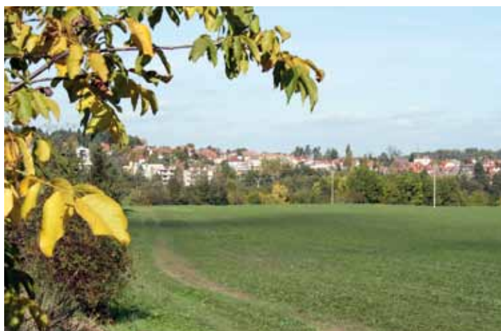
F 7 – Podzimní nálada I.