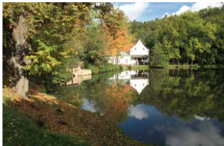
F 3 – Válcový mlýn