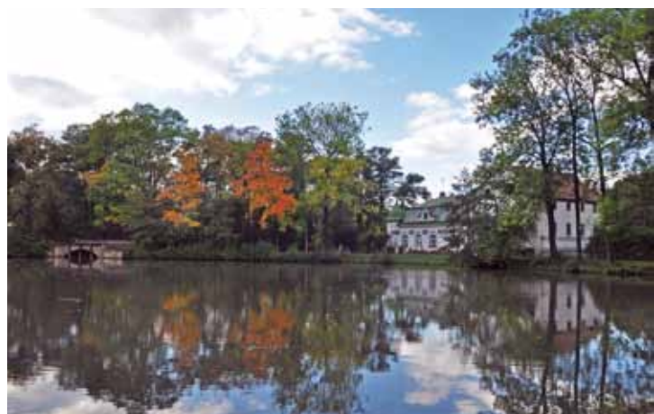
F 2 – Den u mlýna s rybníkem