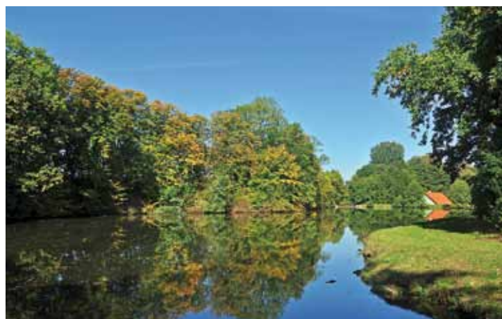
F 1 Úvalský Horní