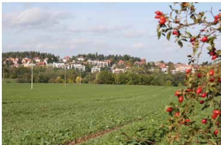
F 8 - Podzimní nálada II.