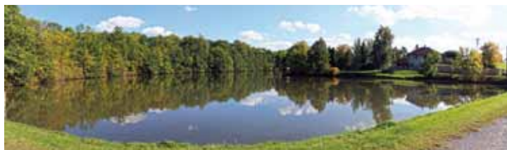
F 6 – Úvalský malý