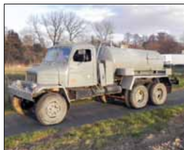
Provoz kanalizace, str. 10

Nová školní jídelna začala sloužit žákům Základní školy Úvaly od počátku roku 2013