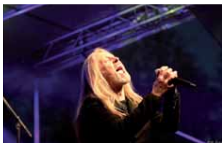
Lístky z kalendáře...