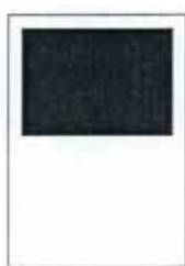
1/2 strany 190x128 mm