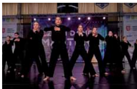
Tančíme a soutěžíme dál...