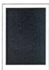
1/1 strany (zrcadlo) 190x262 mm 1/1 na spad 210x297 mm

Rozměry časopisu: před ořezem 216x303 mm, po ořezu 210x297 mm Rozměry zrcadla: 190x262 mm