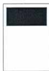
1/3 strany 190x87 mm