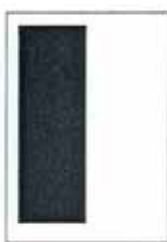
1/2 strany 90x262 mm