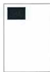
1/8 strany 90x61 mm

Rozměry inzertních stran: šířka x výška v milimetrech