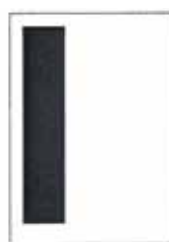
1/3 strany 59x262 mm