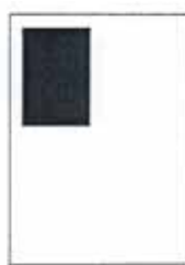
1/4 strany 90x128 mm