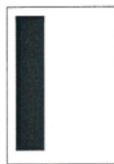
1/3 strany 59x262 mm