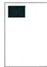
1/8 strany 90x61 mm

Rozměry inzerčních stran: šířka x výška v milimetrech