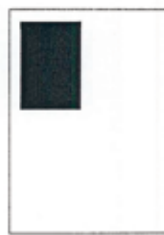
1/4 strany 90x128 mm