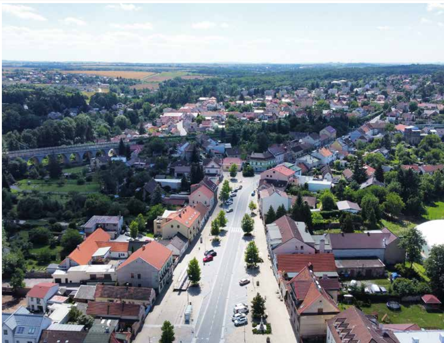
Úvalské obzory