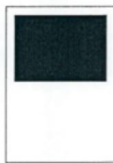
1/2 strany 190x128 mm