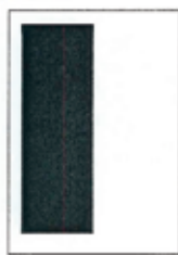
1/2 strany 90x262 mm