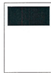
1/3 strany 190x87 mm