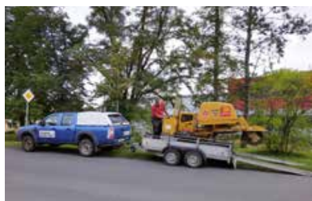
Všimli jsme si, že...