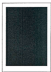
1/1 strany (zrcadlo) 190x262 mm 1/1 na spad 210x297 mm