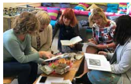
Novinky z úvalské školy