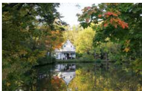
Všimli jsme si, že...