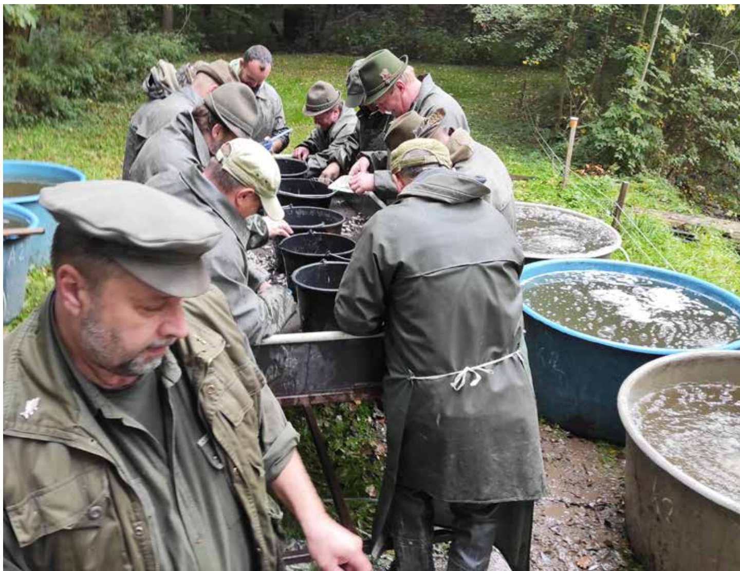
Výlov Dolního Úvalského