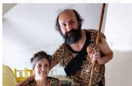
Lístky z kalendáře... 8

Kresby: děti MŠ Úvaly.