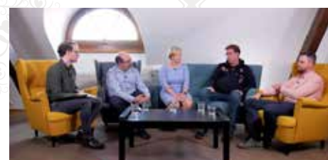
Digitální škola: Funkční zapojení technologií do výuky