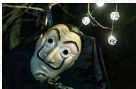
Lampionů bylo víc než hvězd 13